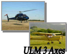
ULM 3 Axes

Selon programme ci-dessus 50/60 personnes